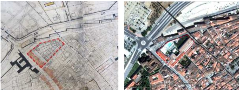
Figura 9: Palácio dos Sepúlvedas (1945/2013).

Nos antigos quintalões de casas senhoriais seculares, que devido à sua amplitude de área livre de construção têm permitido, através da aplicação dos respetivos regulamentos dos Planos de Urbanização, a aprovação e sequente construção de novas áreas de construção quase sempre exageradas. A eliminação dos jardins de época, respetivas hortas assim como todas as construções de apoio a elas associadas foram seguramente aspetos negativos nas intervenções que deveriam ter sido mais cuidadosamente salvaguardados. O vetusto Palácio dos Sepúlvedas (Fig. 9), que remonta ao século XVI, e o imponente Palácio Barahona (Fig. 10), já do século XIX, são exemplos de antigas construções com amplos espaços livres privados hoje, contudo, já quase inexistentes.