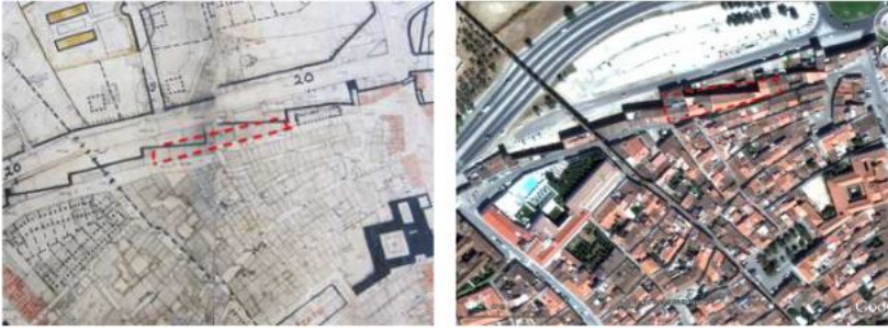
Figura 8: Pt's Lagoa e Avis (1945/2013).