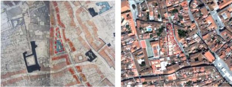
Figura 5: Mosteiro de Stª Catarina (1945/2013).