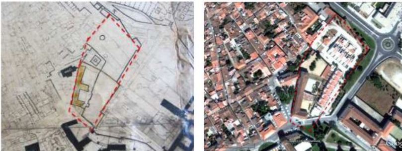
Figura 3: Mosteiro de Stª Mónica (1945/2013).