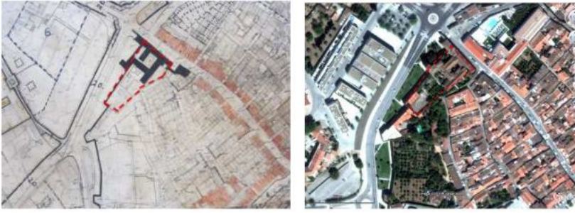
Figura 11: Mosteiro de Nossa Senhora do Monte do Calvário (1945/2013).

Estes aspetos referentes à evolução desta cidade são observáveis pela comparação entre o primeiro plano de urbanização, que data de 1945 e o plano de urbanização atual (Figuras 15 e 16).