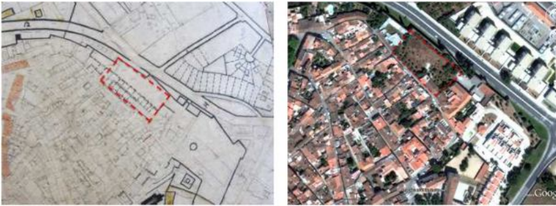
Figura 12: Espaço sobranete livre entre a muralha e malha urbana (1945/2013).

Estes aspetos referentes à evolução desta cidade são observáveis pela comparação entre o primeiro plano de urbanização, que data de 1945 e o plano de urbanização atual (Figuras 15 e 16).