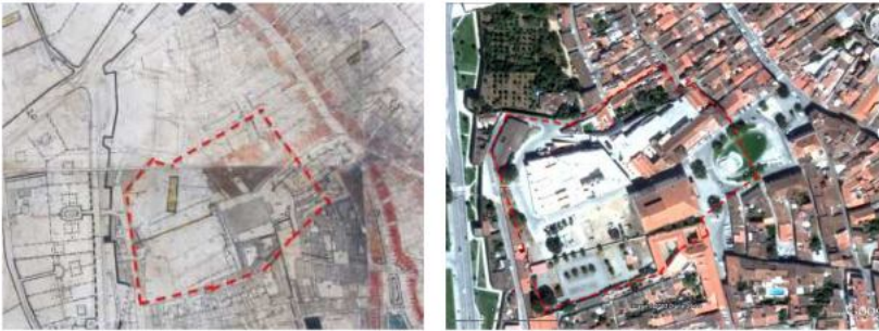
Figura 2: Convento de S. Domingos (1945/2013).