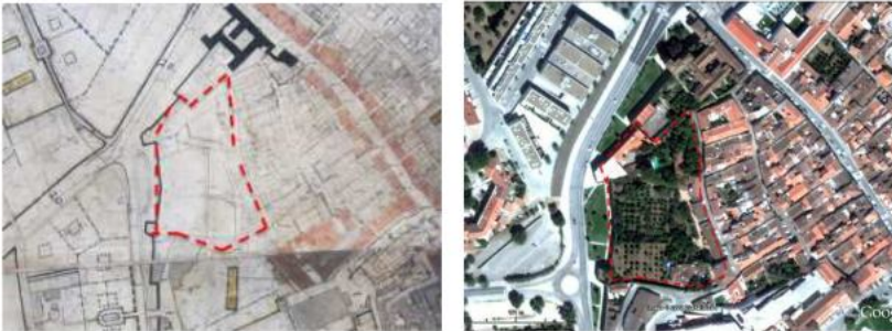
Figura 13: Espaço sobranete livre entre a muralha e malha urbana (1945/2013).