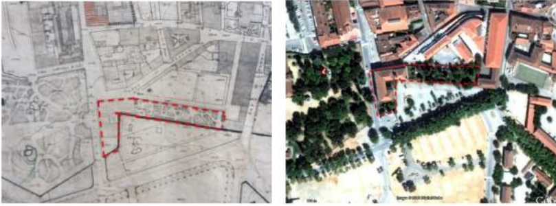
Figura 10: Palácio Barahona (1945/2013).