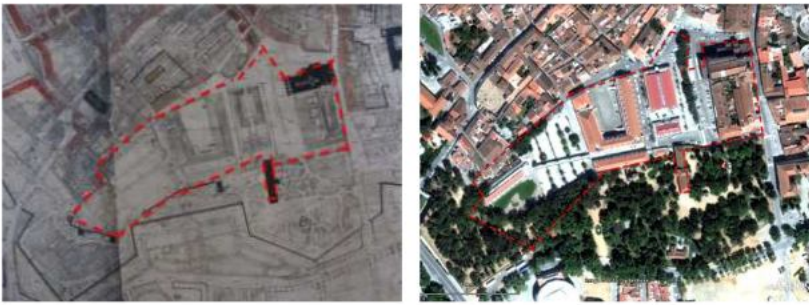
Figura 1: Convento de S. Francisco (1945/2013).