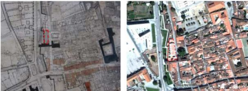
Figura 7: Pt as Alconchel e Lagoa (1945/2013).