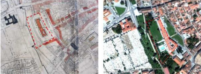
Figura 6: Pt as Alconchel e Raimundo (1945/2013).

São exemplos, os casos de estudo referentes aos espaços compreendidos entre a Porta de Alconchel e a Porta do Raimundo (Fig. 6), entre a Porta de Alconchel e da Lagoa (Fig. 7), e por último entre a Porta da Lagoa e a Porta de Avis (Fig. 8).