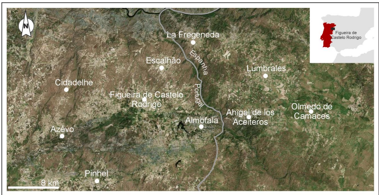
Figura 1. Mapa de localização geográfica da área de trabalho. Modificado de Google Earth .

A área objecto de estudo inicial estava limitada a oriente pelo Rio Águeda, nas imediações de Figueira de Castelo Rodrigo (centro-norte de Portugal), e a ocidente pelo sector de Penha de Águia, a Oeste de Figueira de Castelo Rodrigo. Posteriormente, durante a condução do estudo, verificou-se a necessidade de alargar a área em análise, passando o limite ocidente a Olmedo de Camaces, em Espanha, e em Portugal a Azêvo, a ocidente do Rio Côa, na Serra da Marofa. Em termos de latitude, também se propôs um alargamento, passando a estar limitado a Norte por Barca d'Alva e a Sul por Almofala (Fig. 1) e não constringido somente à Serra da Marofa e a Figueira de Castelo Rodrigo.