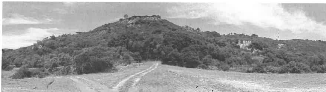
Conventos de Alferrara, 2010

Será essa a ambição maior destas intervenções que ao responder à necessária e urgente estabilização das estruturas preexistentes, implementaram opções éticas e metodológicas no processo de valorização dos Conventos e nas pequenas edificações que fazem parte integrante deste conjunto monástico erguido no sítio de Alferrara.