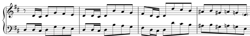
Exemplo 15b. Início da coda. Sonata em ré maior (n.º 1), 1.º andamento, cc. 115-8

Na Sonata em lá maior (n.º 9/i), a introdução também é longa e está escrita no mesmo andamento da forma de sonata. Verifica-se que o material da introdução é utilizado quer na composição da forma de sonata, nomeadamente na construção do módulo de Fortspinnung , quer na coda que, contrariamente à sonata anterior, é bastante longa.