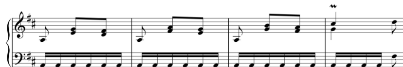
Exemplo 10a. Motivo ascendente de terceiras intercalado com nota pedal. Minueto (n.º 10), cc. 45-8

Verifica-se igualmente a utilização do mesmo material musical em obras distintas, como é o caso do motivo ascendente de terceiras intercalado com uma nota pedal que se encontra, em tonalidades diferentes, no Minueto (n.º 10) e no terceiro andamento da Sonata em ré maior (n.º 1/iii).