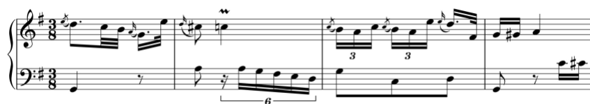
Exemplo 6a. Cromatismos e apogiaturas. Sonata em sol maior (n.º 7), 2.º andamento, cc. 1-4

Estes elementos estilísticos associam-se, em algumas sonatas (n.ºs 1, 7 e 9), a outros elementos característicos do empfindsamer Stil , tais como cromatismos, apogiaturas dissonantes precedidas por saltos expressivos, flutuações de dinâmica e contrastes tonais inesperados.