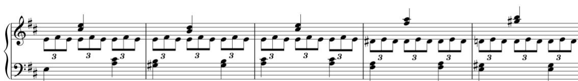
Exemplo 14b. Excerto da zona do tema secundário. Sonata em ré maior (n.º 1), 1.º andamento, cc. 56-60

A coda é curta e baseia-se no motivo inicial do tema primário, que é reforçado pela duplicação à oitava.