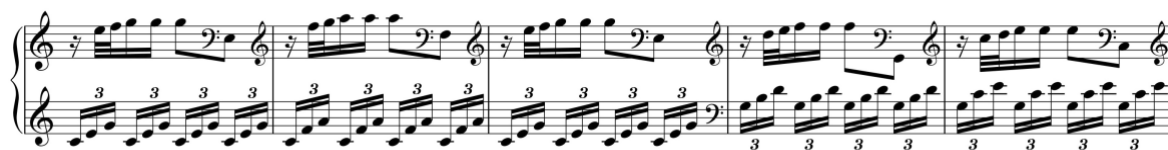
Exemplo 7. Deslocação parcial de um motivo acompanhado por acordes arpejados. Sonata em dó maior (n.º 2), cc. 10-4

Constata-se também a utilização frequente de uma melodia com acordes arpejados ou com repetição de intervalos de terceira, acompanhada por uma linha melódica de baixo à distância de terceira ou décima e de sexta, neste último caso com recurso também ao cruzamento de mãos.