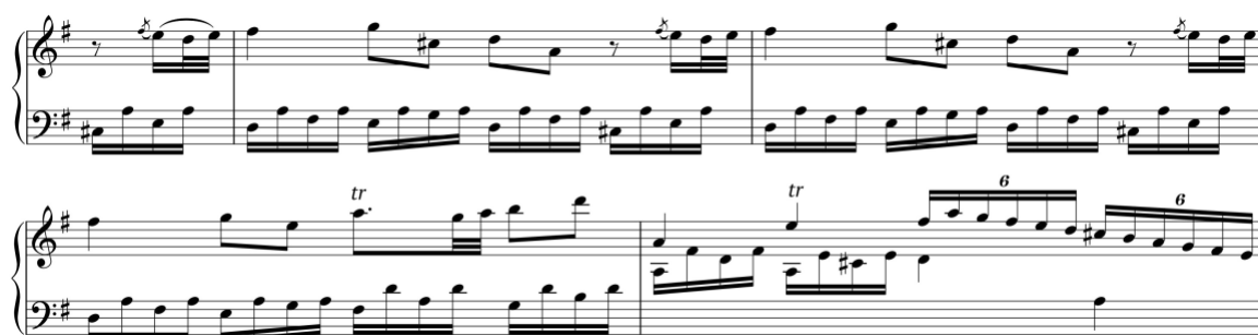
Exemplo 3. Tema conclusivo na exposição. Sonata em sol maior (n.º 7), 1.º andamento, cc. 20-4

Avondano cria assim um tema secundário contrastante no andamento inicial de duas sonatas com os formatos de proposição e de frase, sendo precedido por um módulo preparatório no caso da Sonata em sol maior (n.º 7/i). Esta sonata incorpora também o único tema conclusivo presente nas suas sonatas, tratando-se, portanto, de uma sonata com três temas.