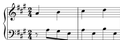
Exemplo 5b. Do-Re-Mi . Sonata em lá maior (n.º 9), 2.º andamento, cc. 1-2

Estes elementos estilísticos associam-se, em algumas sonatas (n.ºs 1, 7 e 9), a outros elementos característicos do empfindsamer Stil , tais como cromatismos, apogiaturas dissonantes precedidas por saltos expressivos, flutuações de dinâmica e contrastes tonais inesperados.