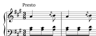
Exemplo 17. Mudança de métrica. Sonata em lá maior (n.º 9), 2.º andamento, cc. 43-4 (Fonte: P-Ln M.M. 4329, f. 12v)

aplicado por Avondano nas restantes sonatas, através da introdução de tonalidades inesperadas (ver Exemplos 6b e 16a). Avondano reforça esta forma de sonata colocando-a no quadro introdução-coda, reutilizando o material destes espaços na sua composição e inserindo-a numa sonata cujo ciclo é complementado, de forma excepcional, por um andamento composto na forma ternária dupla (ABA'-ABA'). Cada uma destas formas ternárias apresenta uma métrica diferente, estando a primeira escrita com métrica dupla (ver Exemplo 5b) e a segunda com métrica tripla.