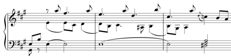
Exemplo 16c. Excerto da coda. Sonata em lá maior (n.º 9), 1.º andamento, cc. 58-60