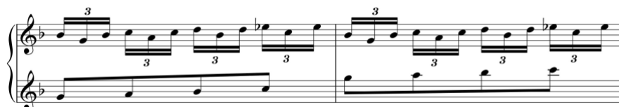
Exemplo 8b. Melodia com repetição de intervalos de terceira. Sonata em dó maior (n.º 3), 2.º andamento, cc. 34-5

O uso recorrente deste tipo de figurações resulta no aparecimento de motivos semelhantes em algumas das suas obras, como se pode verificar em duas sonatas escritas na tonalidade de dó maior.