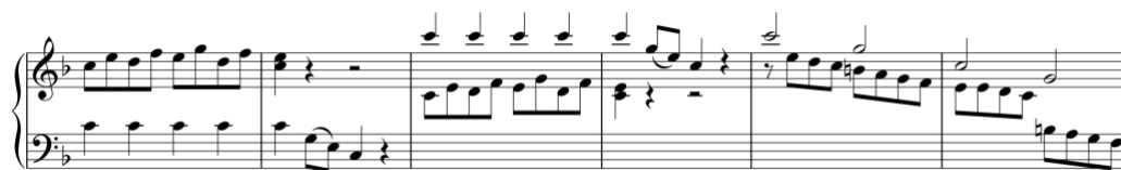
Exemplo 13b. Início do tema primário na reexposição. Sonata em fá maior (n.º 6), 1.º andamento, cc. 75-80