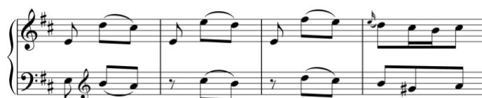
Exemplo 10b. Motivo ascendente de terceiras intercalado com nota pedal. Sonata em ré maior (n.º 1), 3.º andamento, cc. 15-8