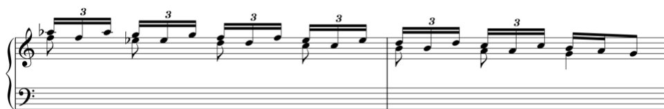
Exemplo 9a. Motivo melódico com acompanhamento à distância de terceira. Sonata em dó maior (n.º 2), cc. 54-5

O uso recorrente deste tipo de figurações resulta no aparecimento de motivos semelhantes em algumas das suas obras, como se pode verificar em duas sonatas escritas na tonalidade de dó maior.