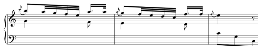
Exemplo 5a. Prinner . Sonata em dó maior (n.º 4), 2.º andamento, cc. 4-6

As sonatas de Pedro António Avondano apresentam características identificativas do estilo galante através da utilização de um ritmo harmónico lento, de frequentes meias-cadências e cadências autênticas perfeitas antecedidas pela fórmula 6/4-5/3, de uma melodia geralmente fragmentada e agrupada em unidades de dois compassos, com séries de tercinas em semicolcheias, ritmos pontuados e algumas síncopas, e de um acompanhamento variado integrando acordes, acordes arpejados, baixo de Alberti, murky bass e, por vezes, o baixo de tambor. Nestas obras foram identificados alguns dos esquemas galantes definidos por Robert Gjerdingen, constatando-se uma utilização frequente dos esquemas Prinner e Do-Re-Mi . 31