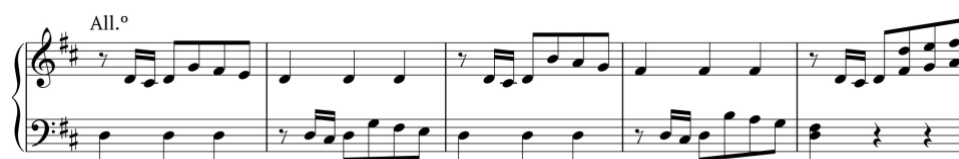
Exemplo 15a. Início do tema primário na exposição. Sonata em ré maior (n.º 1), 1.º andamento, cc. 31-5

A coda é curta e baseia-se no motivo inicial do tema primário, que é reforçado pela duplicação à oitava.