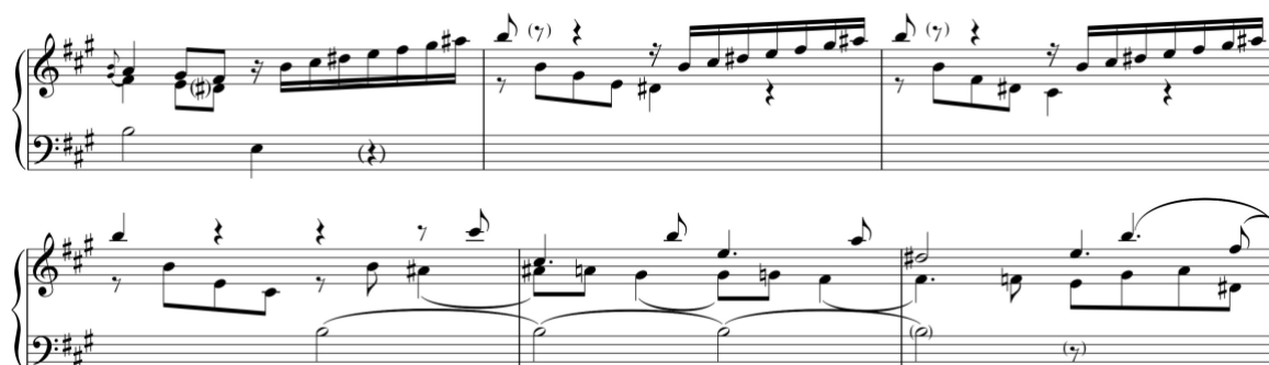
Exemplo 16a. Excerto da introdução. Sonata em lá maior (n.º 9), 1.º andamento, cc. 8-13

Na Sonata em lá maior (n.º 9/i), a introdução também é longa e está escrita no mesmo andamento da forma de sonata. Verifica-se que o material da introdução é utilizado quer na composição da forma de sonata, nomeadamente na construção do módulo de Fortspinnung , quer na coda que, contrariamente à sonata anterior, é bastante longa.