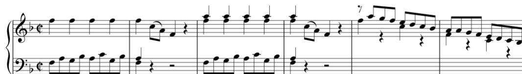
Exemplo 13a. Início do tema primário na exposição. Sonata em fá maior (n.º 6), 1.º andamento, cc. 1-6

No que respeita à secção de reexposição, Avondano reutiliza o tema primário aplicando algumas modificações no primeiro andamento da Sonata em fá maior (n.º 6/i). O tema é retomado com as linhas melódicas invertidas, com exceção de poucos compassos, na tonalidade da dominante e alcança a tonalidade da tónica ao longo da zona do tema primário, sendo por isso classificada de reexposição «deformada».