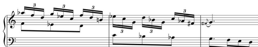
Exemplo 9b. Motivo melódico com acompanhamento à distância de décima. Sonata em dó maior (n.º 4), 2.º andamento, cc. 40-2