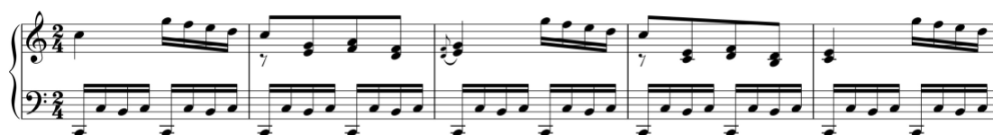
Exemplo 11a. Início do tema primário. Sonata em dó maior (n.º 3), 1.º andamento, cc. 1-5

A primeira técnica é aplicada diferentemente nos andamentos iniciais de duas sonatas. Na Sonata em dó maior (n.º 4/i), Avondano inclui uma reprodução exata do tema na oitava inferior. Na Sonata em dó maior (n.º 3/i), o compositor inclui o tema modificado na mesma tessitura, ainda que alterando a tessitura interna dos respetivos motivos. A modificação assenta na omissão do acompanhamento, em murky bass , e na distribuição da melodia pelas duas mãos.