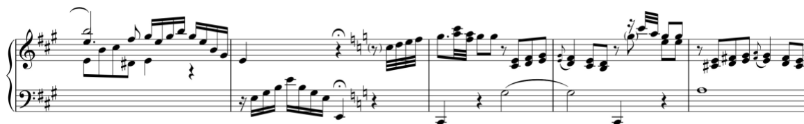
Exemplo 6b. Contrastes tonais e flutuações de dinâmica. Sonata em lá maior (n.º 9), 1.º andamento, cc. 15-9

Além destes recursos, Avondano serve-se de figurações melódico-rítmicas para transmitir uma ideia ou sentimento, resultando numa espécie de símbolo. Neste sentido, reconhece-se a presença de determinados símbolos ou tópicos, descritos por Leonard Ratner, como se pode ver no Exemplo 1 onde coexistem o uníssono orquestral (cc. 1-3), a fanfarra (cc. 4-6) e o estilo cantado (cc. 7-9). 32