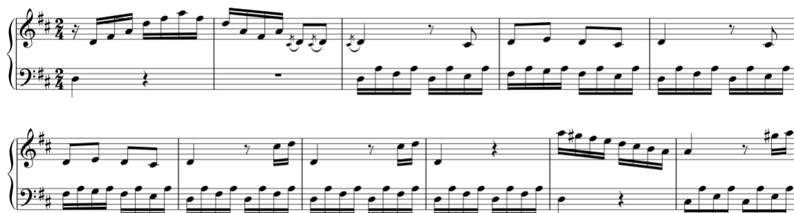
Exemplo 12a. Módulo preparatório e início do tema primário na exposição. Sonata em ré maior (n.º 5), 1.º andamento, cc. 1-11

A segunda técnica surge no primeiro andamento da Sonata em ré maior (n.º 5/i) e dá origem ao aparecimento do módulo de apresentação do tema primário na tonalidade da dominante, após os módulos de Fortspinnung .