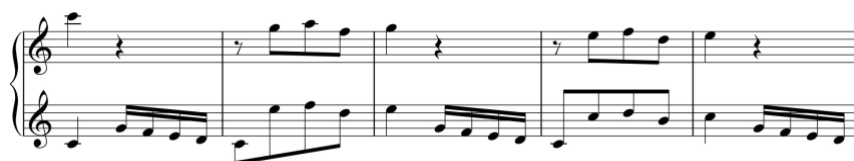
Exemplo 11b. Início da repetição do tema primário. Sonata em dó maior (n.º 3), 1.º andamento, cc. 11-5