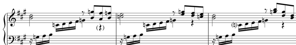
Exemplo 16b. Excerto do módulo de Fortspinnung . Sonata em lá maior (n.º 9), 1.º andamento, cc. 33-5