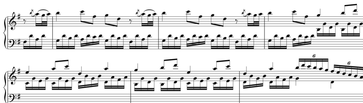
Exemplo 4. Efeito de coda. Sonata em sol maior (n.º 7), 1.º andamento, cc. 52-8

todas as zonas da exposição, embora com a omissão de alguns módulos, ocorre em três andamentos (n.º 3/iii, n.º 4/i e n.º 8), enquanto que os restantes andamentos omitem a zona de transição (n.º 3/i e n.º 7/i) ou a zona conclusiva (n.º 6/i), sendo neste último caso intercalado um módulo da zona do tema primário na tonalidade homónima menor antes da retoma dos módulos de Fortspinnung . No andamento inicial da Sonata em sol maior (n.º 7/i) a reexposição é ligeiramente alargada, através da expansão de um módulo do tema conclusivo, produzindo o efeito de coda. 30