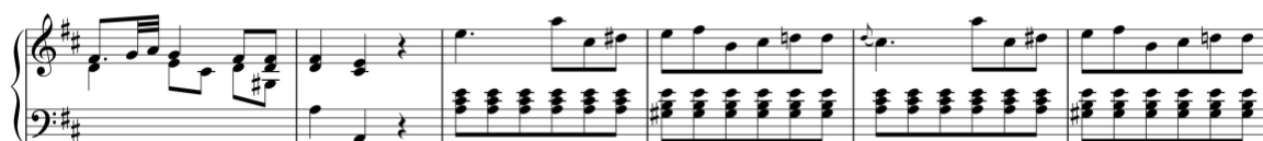
Exemplo 2. Final da zona de transição e início do tema secundário. Sonata em ré maior (n.º 1), 1.º andamento, cc. 45-50 (Fonte: P-Ln M.M. 337, ff. 39r-v)

Avondano cria assim um tema secundário contrastante no andamento inicial de duas sonatas com os formatos de proposição e de frase, sendo precedido por um módulo preparatório no caso da Sonata em sol maior (n.º 7/i). Esta sonata incorpora também o único tema conclusivo presente nas suas sonatas, tratando-se, portanto, de uma sonata com três temas.