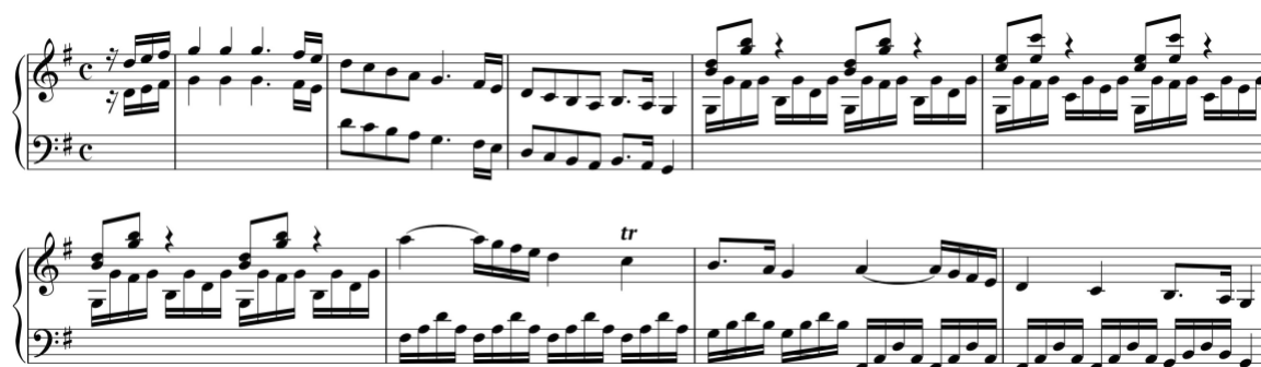
Exemplo 1. Tema primário antecedido por um módulo preparatório. Sonata em sol maior (n.º 8), cc. 1-9

Os andamentos que estão estruturados numa forma de sonata têm geralmente uma exposição contínua, existindo apenas dois andamentos (n.º 1/i e n.º 7/i) cuja exposição está dividida em duas partes por meio de uma cesura mediana. O tema primário apresenta-se como uma proposição ou como uma frase organizada por um a três blocos, no máximo de dez compassos, sendo antecedido por um módulo preparatório em dois andamentos (n.º 5/i e n.º 8). 29