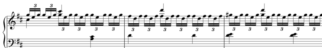
Exemplo 14a. Excerto da introdução. Sonata em ré maior (n.º 1), 1.º andamento, cc. 18-20

Na Sonata em ré maior (n.º 1/i) a forma de sonata contém a indicação Allegro , o que sugere que a introdução seja interpretada num andamento lento, valorizando a expressividade da respetiva escrita. Esta introdução é longa, está organizada segundo um formato embrionário de exposição de uma forma de sonata e contém material que é reutilizado, embora modificado, na composição da forma de sonata, nomeadamente na zona do tema secundário.