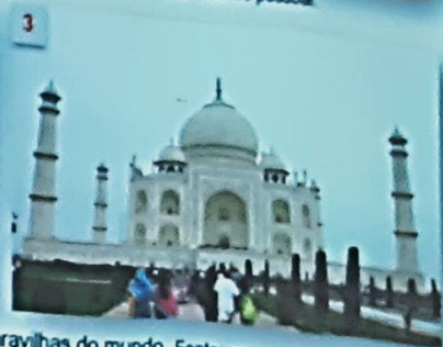
1. Entrada do forte de Agra. 2. Fatehpur Sikri, a "cidade da vitória". 3. O Taj Mahal, uma das maravilhas do mundo.