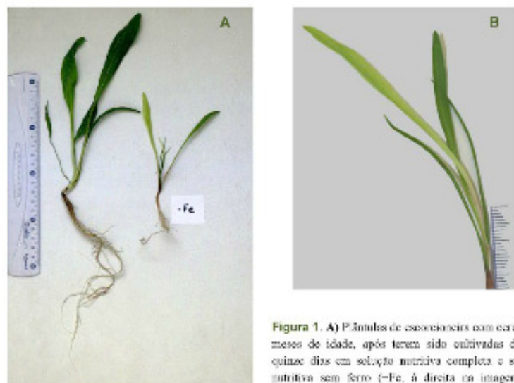
Figura 1. A) Plântulas de escorçoceiras com cerca de 2 meses de idade, após terem sido cultivadas durante quinze dias em solução nutritiva completa e solução nutritiva sem ferro (-Fe, à direita (na imagem). B) Aspecto de plântula deficiente em ferro.

Apesar da carência extrema das soluções de cultura não surgiram sintomas visuais generalizados, nítidos e identificáveis de deficiência mineral em nenhum dos tratamentos com excepção do tratamento sem ferro onde os sintomas observados envolveram o desenvolvimento de uma clorose uniforme, um dos sintomas considerados mais comuns da deficiência em ferro (Fontes, 2004). A clorose tornou-se bem patente a partir do 7.º dia, afectando sobretudo as folhas mais jovens. Após 15 dias era nítida a existência de um gradiente na clorose férrica com as folhas mais jovens muito claras, as folhas mais velhas com uma clorose menos acentuada e os longos cotilédones foliáceos inalterados o que é típico de um elemento de mobilidade limitada. Na Figura 1 podem observar-se os sintomas visíveis da deficiência em ferro.